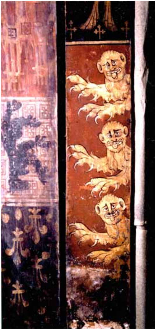
Fig. 6 : Metz, 28, rue de la Chèvre, plafond peint, sapin, détail, armoiries du roi d'Angleterre : de gueules à trois léopards d'or, XIV e siècle, Musées de la Cour d'Or.