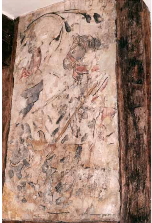
Fig. 15 : Metz, 9 rue des Murs, 1 er étage, saint Georges, vers 1460-1480.