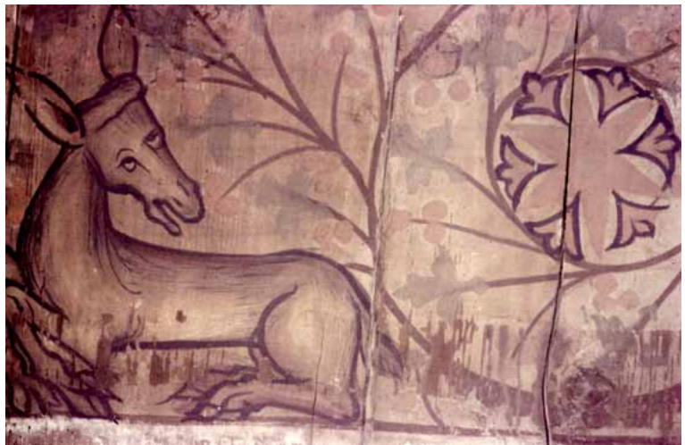
Fig. 5b : Metz, 12 rue du Change, plafond peint, 1356, détail (cl. M. Euzenat, 1963).

Les trois poutres, découvertes en 1967 dans la maison située au 28 rue de la Chèvre 17 , présentent des armoiries sur leurs trois faces visibles (fig. 6). On remarque celles du roi de France, du roi d'Angleterre, du roi de Castille et de Léon, du duc Robert de Bar, de la maison de Nassau ou encore celles du comte de Spanheim et de Vianden. La maîtrise technique et le dessin expressif de cet ensemble du XIV e siècle sont remarquables.