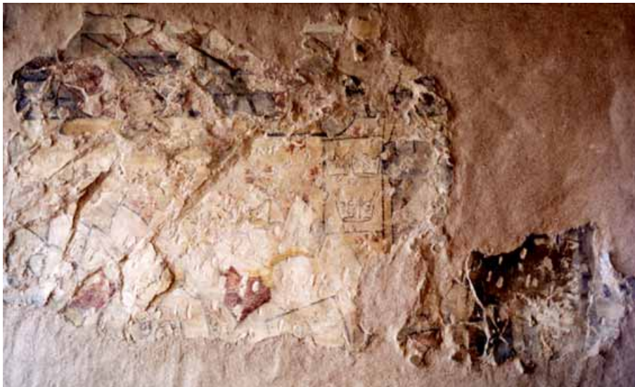
Fig. 8a : Metz, 12 rue des Clercs, peinture provenant d'une salle du rez-de-chaussée, cortège d'hommes dont le roi Arthur (H. 86 cm, L. 140 cm), 2 e moitié du XIV e siècle, peinture déposée aux Musées de la Cour d'Or.