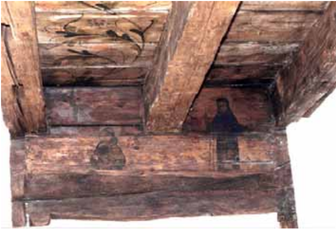
Fig. 14 : Metz, 9 rue des Murs, rez-de-chaussée, plafond, ais d'entrevous, saint François et sainte Claire, vers 1460-1480.