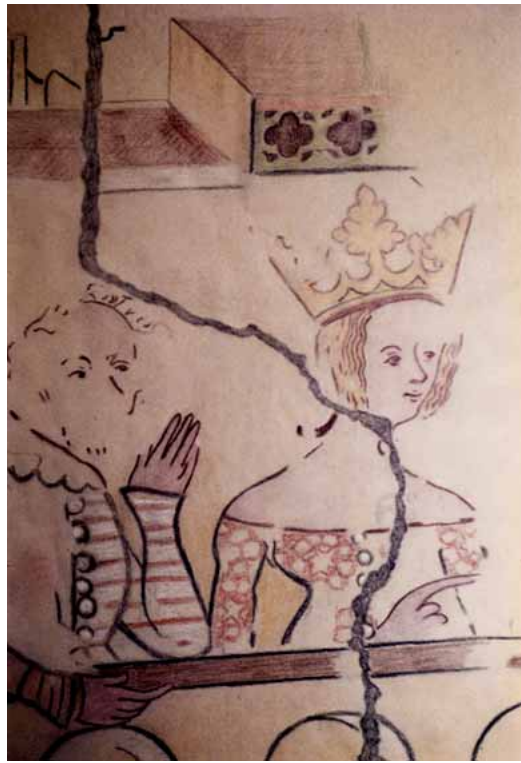
Fig. 11 : Metz, 14 rue du Change, couple, relevé d'une peinture murale détruite, fin XIV e -début XV e siècle (M. Euzenat, 1964).

La femme, couronnée, pointe son index vers une scène se déroulant sans doute devant eux. Le type de costume et les éléments architecturaux représentés permettent de dater la peinture de la fin du XIV e ou du début du XV e siècle. La scène évoquant a priori un sujet profane, peut toutefois être rapprochée d'un manuscrit en dialecte lorrain illustré de dessins de la vie de saint Clément, évêque de Metz (Paris, BNF, Arsenal, ms. 5227, fin XIV e siècle). L'une des scènes montre un couple derrière une balustrade (f. 12) qui n'est pas sans rappeler le détail de la peinture murale. Les costumes trouvent également des parallèles dans les deux œuvres : pourpoints bourrés, tissus rayés et manches couvrant les poignets pour les hommes (f. 13v, 14, 15v), larges décolletés dégageant les épaules pour les femmes. La scène peinte dans la maison pourrait être une illustration de la même légende de saint Clément, si appréciée par les messins.