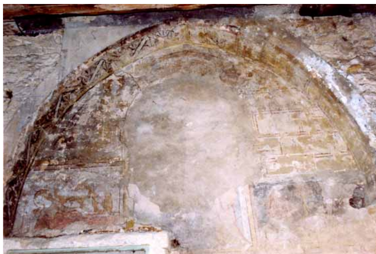
Fig. 4 : Metz, rue de la Fontaine, ancien hôpital Saint-Nicolas, 1 er étage, niche peinte, partie supérieure, faux appareils (XIII e siècle) et scènes de l'enfance du Christ (vers 1300) (cl. I. Hans-Collas, 1991).

Ce cas de campagnes successives, parfois peu espacées dans le temps, n'est pas isolé. Dans une maison de la place Saint-Louis (n° 2), un décor de faux appareil se superposait avec un décor héraldique affichant les armoiries « de gueules à l'aigle d'argent » attribuées à la famille de Pappemiatte attestée à Metz dans les années 1380 11 . Au 74 en Fournirue, un décor losangé meublé de motifs de tours couvre un décor de fleurettes rouges 12 .