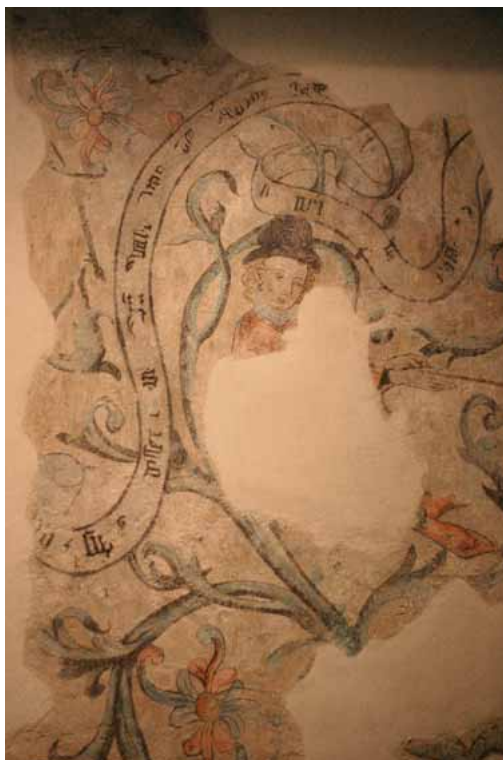
Fig. 20 : Strasbourg, 15 rue des Juifs, 1 er étage, jeune homme assis dans des rinceaux (cl. I. Hans-Collas, 2007).