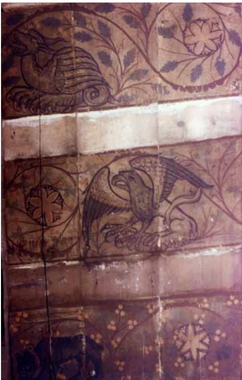
Fig. 5a : Metz, 12 rue du Change, plafond peint, 1356, vue d'ensemble (cl. M. Euzenat, 1963).

Plusieurs plafonds peints du plus grand intérêt ont été découverts dans les années 1960, au moment où le centre ville de Metz a subi des transformations considérables entraînant la destruction de nombreuses maisons anciennes. Malgré l'engagement honorable de bon nombre de bénévoles, les plafonds n'ont pu être sauvés que partiellement. Tel le plafond d'une maison gothique détruite en 1964, située au 12 de la rue du Change 15 . Cette œuvre de grande qualité réunit des motifs d'animaux et un important décor héraldique. Y figurent les armes de l'Empire, celles des royaumes de Suède, de Castille et Léon, de Navarre, de Jérusalem, du roi de Bohême, du roi d'Aragon, du duché de Silésie-Schweidnitz. Ces dernières – parti d'or et de gueules, à l'aigle parti de sable et d'argent – livrent la date probable du plafond : 1356 ; date qui correspond à la venue à Metz d'Anne de Silésie accompagnant son mari, Charles IV roi de Bohême 16 . Des rinceaux habités ornent les entrevous (fig. 5) : hybrides et animaux réels (ours, singe, âne, aigle) se détachent d'un fond de végétaux enroulés en spirale. Malgré l'épaisseur des traits qui dessinent les contours, les lignes accusent une grande souplesse, assurant aux animaux des poses inventives ; l'harmonie des couleurs s'ajoute à cette qualité picturale.