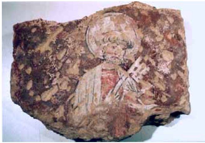
Fig. 13 : Metz, maison, fragment trouvé en fouille, saint Pierre , (H. 36 cm, L. 46 cm, P. 10 cm), milieu du XV e siècle, Musées de la Cour d'Or.