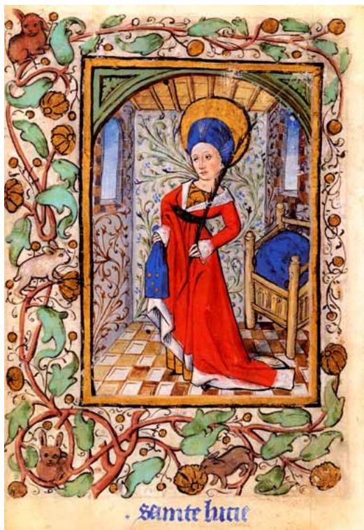
Fig. 17 : Jost Haller, Livre de prières de Lorette d'Herbeviller, vers 1470, BNF, lat. 13279, f. 47v, sainte Lucie.