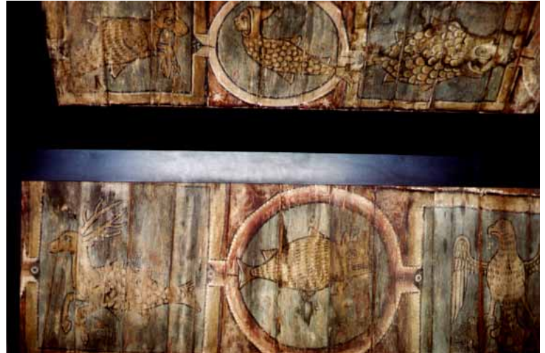
Fig. 1b : Metz, maison, 8 rue Poncelet (Hôtel du Voué), plafond peint, XIII e siècle, chêne - détail du plafond exposé au musée de Metz.