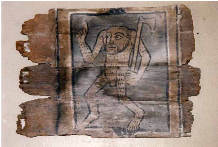
Fig. 2 : Metz, maison, 8 rue Poncelet (Hôtel du Voué), plafond peint, XIII e siècle, fragment, Homme sauvage (H. 61 cm, L. 83 cm), Musées de la Cour d'Or, réserve.