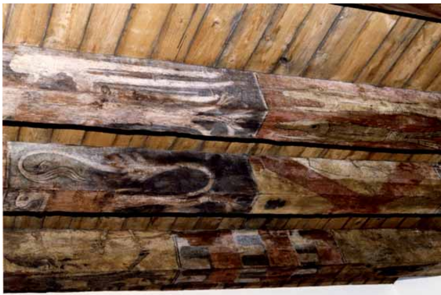
Fig. 9 : Metz, 11 rue de la Fontaine, pièce au 2 e étage, plafond peint armorié, sapin, 2 e moitié du XIV e siècle.

L'omniprésence des décors héraldiques se manifeste aussi bien sur les murs que sur les plafonds comme en témoigné la maison au 11 rue de la Fontaine. L'opération menée en 1990 par le Service régional d'archéologie a permis l'étude d'un ensemble médiéval en excellent état de conservation. Un plafond peint, mis au jour au deuxième étage, présente les armes du comte Henri III de Saarwerden, du duc Robert de Bar, de Waleran de Luxembourg, du duc de Gueldre, etc. (fig. 9), tandis qu'à l'extérieur, sur un mur de la coursière donnant sur une cour, a été mis au jour – au niveau du premier étage – un motif de cygne et les armoiries de deux familles patriciennes de Metz, les Desch et Fauquenel. Une alliance de ces deux familles, attestée entre les années 1350 et le premier quart du XV e siècle 20 , confirme la datation de ce décor dans la seconde moitié du XIV e siècle.