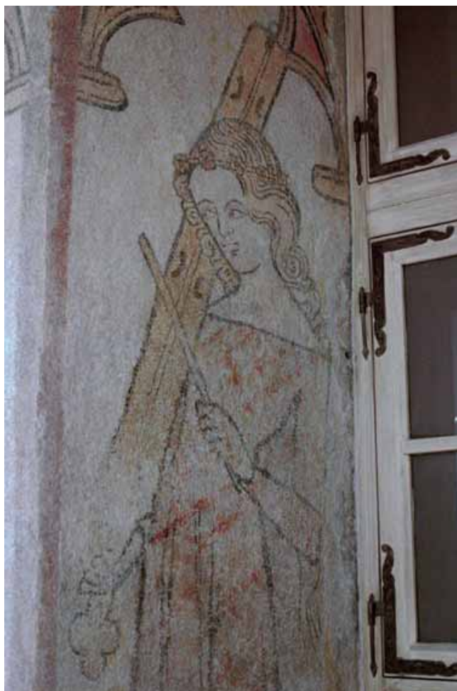
Fig. 10 : Strasbourg, 17 rue des Hallebardes, rez-de-chaussée, femme jouant de la corne marine, 1 ère moitié du XIV e siècle.

À Metz, une opération de sondages a été menée en 1990 par le service régional de l'archéologie au 9 rue de la Fontaine, appartenant à un quartier qui connut un grand essor au Moyen Âge. Elle a révélé la présence de peintures appartenant à la seconde moitié du XIV e siècle sur les trois niveaux de construction à pans de bois. Aux larges surfaces ornées de rinceaux – sur plusieurs niveaux d'habitation – s'ajoute une Crucifixion 24 surmontant le tympan trilobé en bois au rez-de-chaussée.