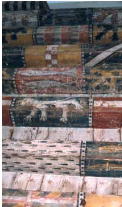
Fig. 7 : Metz, 12 rue des Clercs, plafond armorié, 1384, Musées de la Cour d'Or (© Metz, Musées de la Cour d'Or).