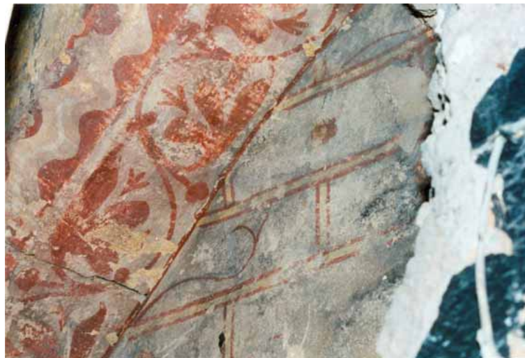
Fig. 3 : Metz, maison, 1, rue des Murs, rez-de-chaussée, mur nord, arcade, faux appareil et rinceaux, 2 e moitié du XIII e siècle.

D'autres exemples confirment la diffusion de certains motifs et leur utilisation pour des grandes surfaces murales. Les fragments trouvés en fouille dans le quartier du Tombois 8 , au nord-est de la ville, rappellent le vaste décor qui ornait la salle capitulaire de l'ancienne abbaye de Sainte-Marie-aux-Nonnains, réalisé au début du XIV e siècle 9 . Entre les figures d'apôtres étaient peintes – à la manière de tentures – de larges surfaces ornées de motifs en fuseau agencés pour former de grandes fleurs stylisées à quatre pétales.