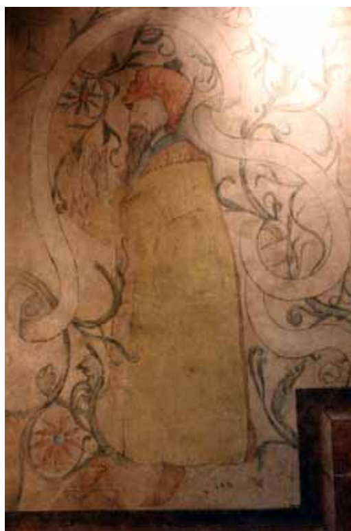
Fig. 19 : Strasbourg, 15 rue des Juifs, salle au 2 e étage, mur ouest, prophète ? (cl. I. Hans-Collas, 2007).