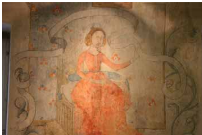
Fig. 18 : Strasbourg, 15 rue des Juifs, salle au 2 e étage, mur sud, dame assise.

David et Goliath 35 . Un cortège de femmes musiciennes devant la porte d'une ville évoque sans doute la fête du retour de David selon l'iconographie habituelle. Le programme est complété par différentes figures à gauche de la dame assise. Un homme, vêtu de noir, est debout devant un enfant juché sur une branche et tenant une grande fleur orange. Son index pointé vers cette fleur et l'autre vers l'enfant – indiquent plutôt un enseignement. À proximité, un couple se tient de part et d'autre d'un arbre sec : la femme, vêtue de noir, tient un râteau tandis que l'homme, dont on ne devine plus que quelques fragments, porte des chausses rouges. À leurs pieds, figurent les armoiries « de gueules au bouquetin d'argent » surmonté d'un casque à lambrequins et d'un cimier présentant le même motif. Ces armes appartiennent à la famille strasbourgeoise des Böcklin von Böcklinsau 36 . Un être hybride, sur le mur oriental, et les motifs variés peints sur les plafonds (feuilles, fleurs stylisées, oiseaux) font partie de la même campagne picturale que le fragment, à l'étage inférieur, représentant un jeune homme assis dans des végétaux (fig. 20) entouré d'un phylactère portant une inscription lacunaire. Des phylactères semblables accompagnent une autre scène, elle aussi non identifiée pour le moment. Elle se trouve aujourd'hui malheureusement à l'extérieur, dans un état ruiné. La scène à caractère intime, montre un couple dans un lit ; une servante s'approche leur tendant les mains.